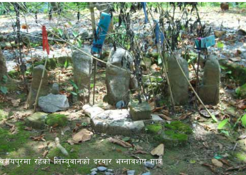
वेजयपुरमा रहेको लिम्बुवानको दरवार भग्नावशेष मात्र

गोरखा दरवार लमजुङ र काठमाडौंको बीचमा पर्छ । पृथ्वीनारायण शाहले पहिले गोरखाबाट लमजुङमाथि आक्रमण गरे । लमजुङका गुरुङ वा घले राजाहरूलाई उसले सबैभन्दा पहिले सिध्याउनु थियो । ती घले पनि दुई किसिमका छन् । एउटा तामाङ र अर्को गुरुङ घले । नुवाकोट घलेहरू तामाङघले हुन् जो अहिले पनि छन् । वास्तवमा तामाङ घले भनेको तामाङले