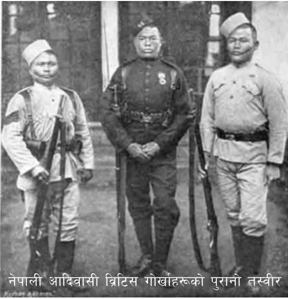
नेपाली आदिवासी ब्रिटिस गोर्खाहरूको पुरानो तस्वीर

राजलाई 'घले' भन्छन् । त्यही 'घले'लाई उनीहरूले घले जस्तो बनाउँदै ल्याएका हुन् । सोही 'घले' वंशलाई घले वंश बनाइएको हो ।