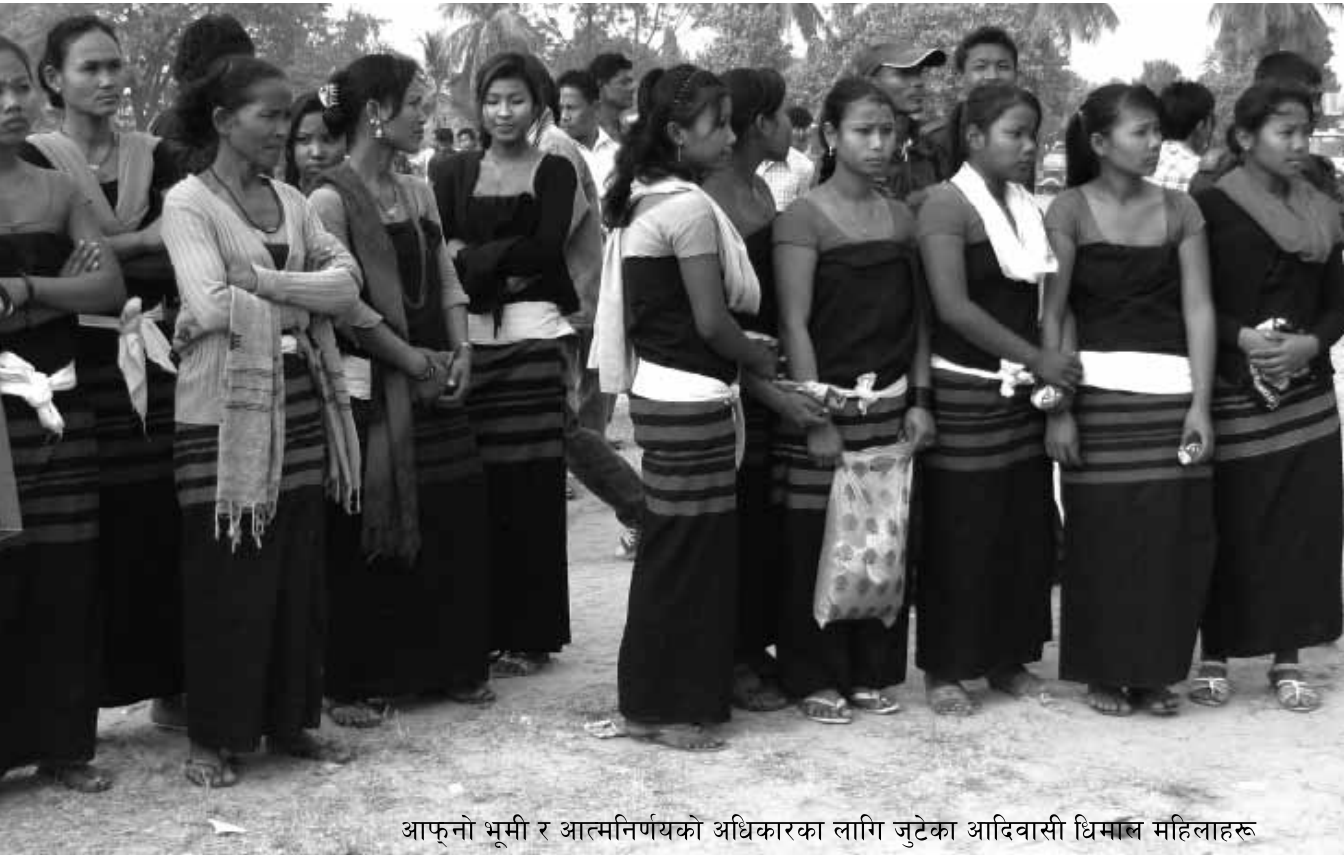
आफ्नो भूमि र आत्मनिर्णयको अधिकारका लागि जुटेका आदिवासी धिमाञ्जलि महिलाहरू

आदिवासीहरूको आत्मनिर्णयको अधिकारको सवालमा दोस्रो विश्वयुद्धपछि औपचारिक रूपमा व्यापक बहस