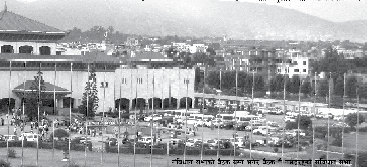
संविधान सभाको बैठक बस्ने भनेर बैठक नै नभइरहेको संविधान सभा