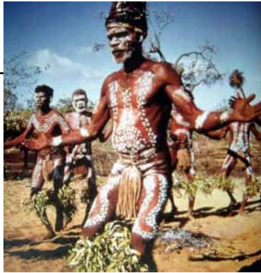
अष्ट्रेलियाका मुलवासी बुशहरू

◆ मार्कण्डेय पुराणअनुसार महाभारतकालमा प्रसिद्ध सात किरात राज्यहरू अश्वकुट,