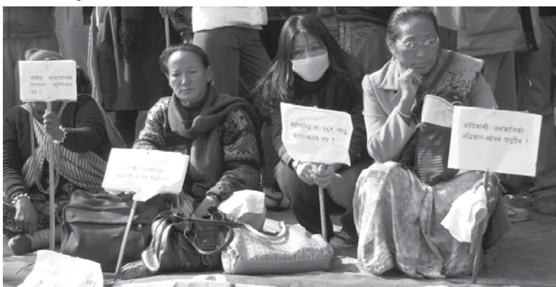
आदिवासी जनजाति महिलाहरू अधिकारका लागि धर्ना दिँदै