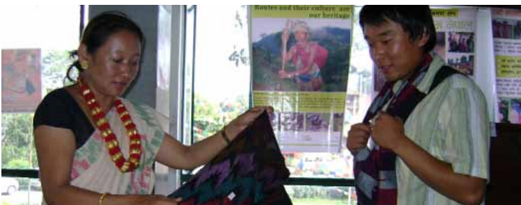
आदिवासी संज्ञानमा आधारित घरेलु ढाका कपडा उत्पादन

अन्त्यमा, मदिरा असल चिज हो वा खराब चिज हो भन्ने सवाल पनि आफ्नै ठाउँमा छ। जबसम्म यो संसारमा मदिराको अस्तित्व रहन्छ तबसम्म यसको असल र खराब पक्षबारे बहस चलिरहन्छ।