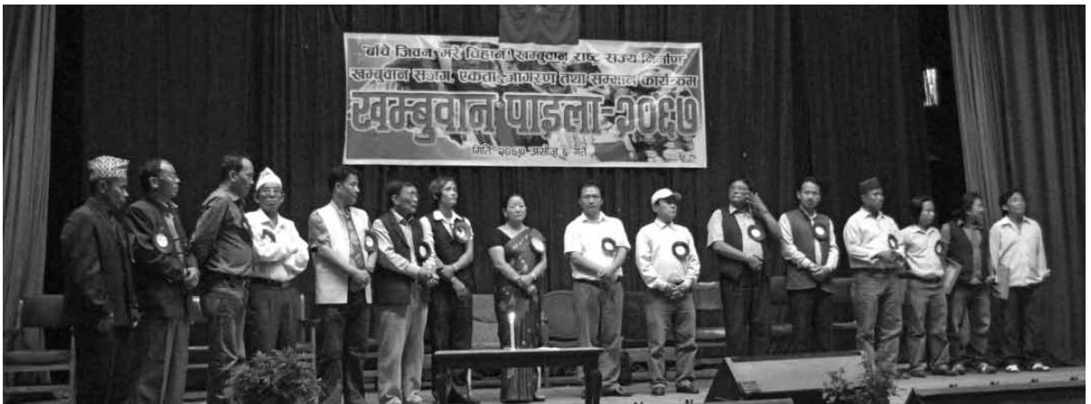
खम्बुवान राष्ट्रिय मोर्चा/खम्बुवान स्वायत्त राज्य परिषदद्वारा काठमाडौँमा आयोजित कार्यक्रम

जातिहरूको आफ्नो पुख्यौली थलोमा निरन्तर बसोवास गरिरहेको र उनीहरूका आ-आफ्नै किसिमका सामाजिक, आर्थिक, भाषिक, धार्मिक र साँस्कृतिक पहिचान भएको आधारलाई जातिहरूको ऐतिहासिक पृष्ठभूमि भनिन्छ। यही ऐतिहासिक पृष्ठभूमिको आधारलाई हेर्ने हो भने शाह राजाहरूको राज्यविस्तार गर्ने महत्वकाङ्क्षा