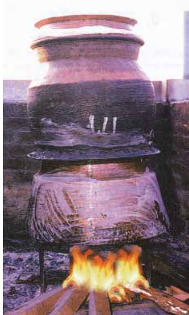
आदिवासी संज्ञानमा आधारित घरेलु मदिरा उत्पादन

र आधुनिक मदिरा उद्योग स्थापना हुँदै गयो त्यसपछि उनीहरूले आफ्नो उत्पादनलाई एकलौटी रूपमा बजारमा बिक्री गर्ने घरेलु मदिरालाई विस्थापित गर्नुपर्ने भयो। जसको लागि उनीहरूले राज्यको सहारा र आड लिएर विभिन्न उत्पीडनको प्रपञ्च रचे। घरेलु प्रविधिबाट उत्पादन भएको मदिरा तुलनात्मक रूपमा सस्तो, शुद्ध र रासायनिक केमिकल प्रयोग नगरी तयार पारिएको हुँदा ग्राहकले घरेलु मदिरा बढी रुचाउनु र बजारमा यसको माग बढ्नु स्वभाविक हो। मुलतः घरेलु प्रविधिबाट परापूर्वकालदेखि नै नेपालका आदिवासी जनजातिहरूले मदिरा बनाउने बनाउने र यसको प्रयोग गर्ने गरेको पाइन्छ। आफ्नो घरायसी प्रयोजनको लागि मात्र नभएर यसको उत्पादन गरेर स्थानीय हाट, बजार, मेलामा बिक्री वितरण गर्ने प्रचलन अझसम्म चलिआएको छ। यो उनीहरूको मौलिक सीप र प्रविधि पनि हो। दुःखका साथ भन्नुपर्छ, विगत २४० वर्षे शाहकाल र वर्तमान अवस्थाका राज्य सञ्चालकहरू आदिवासी जनजातिहरूको यो सीप र प्रविधिलाई समाप्त पार्न चाहन्छन्। उनीहरूको नीतिले भन्छ- “घरेलु मदिरा अवैध मदिरा हो, यसलाई नष्ट गर्नुपर्छ।” उनीहरू के सोच्छन् भने “आदिवासी जनजातिहरू मदिरा बनाउने सीप र प्रविधिमा निपुण छन्। त्यसैले, उनीहरूलाई अझ प्रेरणा र हौसला मिल्यो भने आफ्नो सीप र र प्रविधिलाई अझ विकास गर्न सक्नेछन्। जसको परिणामस्वरूप उनीहरूको स्तर माथि उठ्नेछ र वर्तमान मदिरा बजारमा आफूले हडपेको एकलौटी बजार जनजातिको हातमा जानेछ। यही कारणहरूले गर्दा राज्यसत्ताधारीहरू घरेलु मदिरा उद्योगमाथि बूट बजारिरहेका छन्। यो पङ्क्तिकार स्वयम्ले कैयौंपल्ट आफ्नै