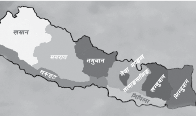
नेपालमा दावी गरिएका जातीय तथा भाषिक स्वायत्त राज्यहरू

अष्ट्रेलियाको राज्य नीतिमा प्रभाव पारेको छ र यसले स्वायत्तता र सामुहिक अधिकारका लागि प्रथमदर्शनसमेत गरेको छ । आखिरीमा, आत्मनिर्णयको अधिकारलाई अल्पसङ्ख्यकहरूको राजनीतिक र स्वायत्तताको अधिकारलाई आन्तरिक संवैधानिक व्यवस्थापन गर्ने सवालमा विस्तृतरूपमा पुनर्विश्लेषण गरिएको छ । क्यानडाको सर्वोच्च अदालतले क्युबेक प्रान्त छुट्टिनसमेत पाउँछ, त, भन्ने सन्दर्भमा यसलाई संघीय सरकारबाट एकतर्फी रूपमा छुट्टिनसमेत पाउने अधिकार भएको जवाफ दिएर, यो छुट्टिने सवालमा एक नयाँ मोड दिएको छ । अदालतले त्यो क्युबेक प्रान्तको छुट्टिनसमेत पाउने अधिकार दिने काम न त क्यानडाको संविधान या त कुनै अन्तर्राष्ट्रिय कानूनअनुसार नै गरेको हो, एक समय क्यानडाको एक भागले बलजफती घोषणा गर्‍यो कि उसले छुट्टिना चाहन्थ्यो र सबै पक्षहरूले यो दावीमाथि सम्झौतामा आउने पन्थो (Quebec Secession Reference (1998) 161 DLR (4 th ) 385) ।