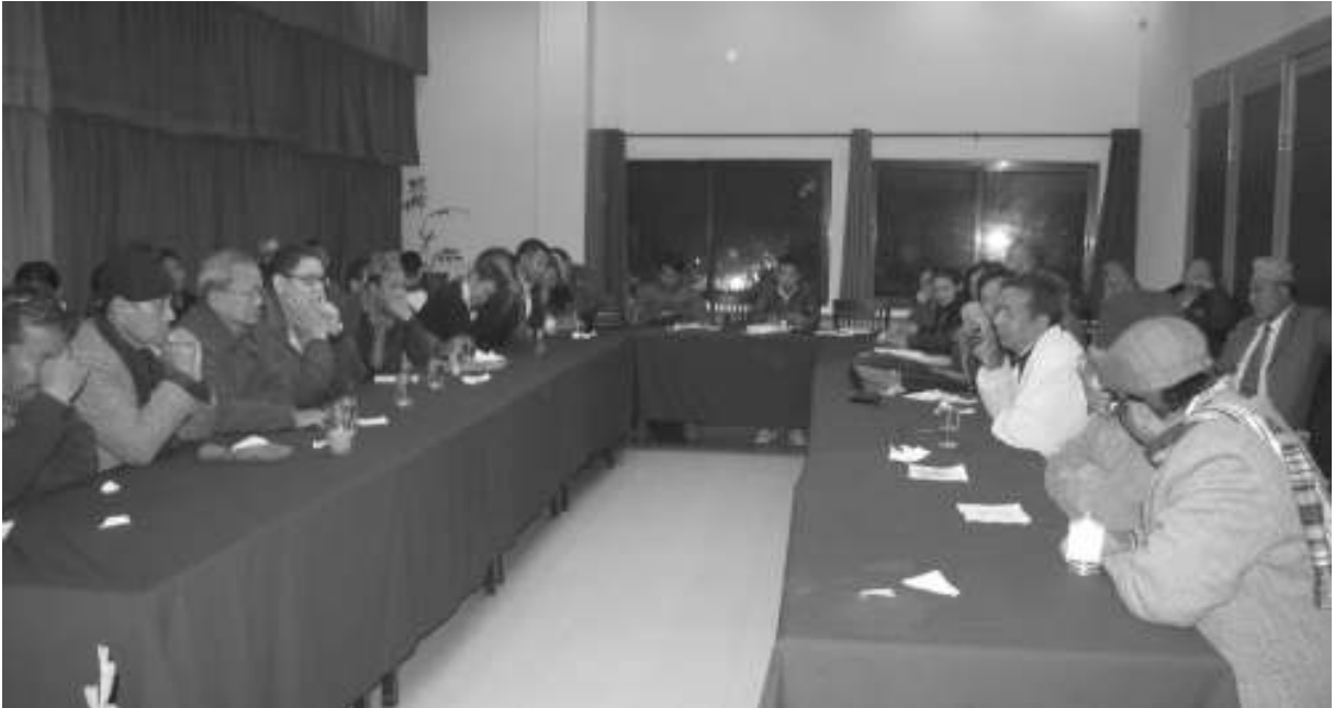
नेपाली आदिवासी जनजाति मञ्च अष्ट्रेलियाद्वारा माघ ७ गते नयाँ वानेश्वर काठमाडौंमा आयोजित एकीकृत दल निर्माण विषयक अन्तरक्रिया ।

नेपालमा संघीयता र आदिवासी जनजातिको मुद्दा र पहिचानको मुद्दालाई आफ्नो सङ्गठनको मुख्य उद्देश्य बनाएर विगतदेखि नै राजनीतिक रूपमा सङ्घर्ष गरिरहेका विभिन्न राजनीतिक दल, सामाजिक संघ-संस्था र स्वतन्त्र बुद्धिजीवीहरू विशेष