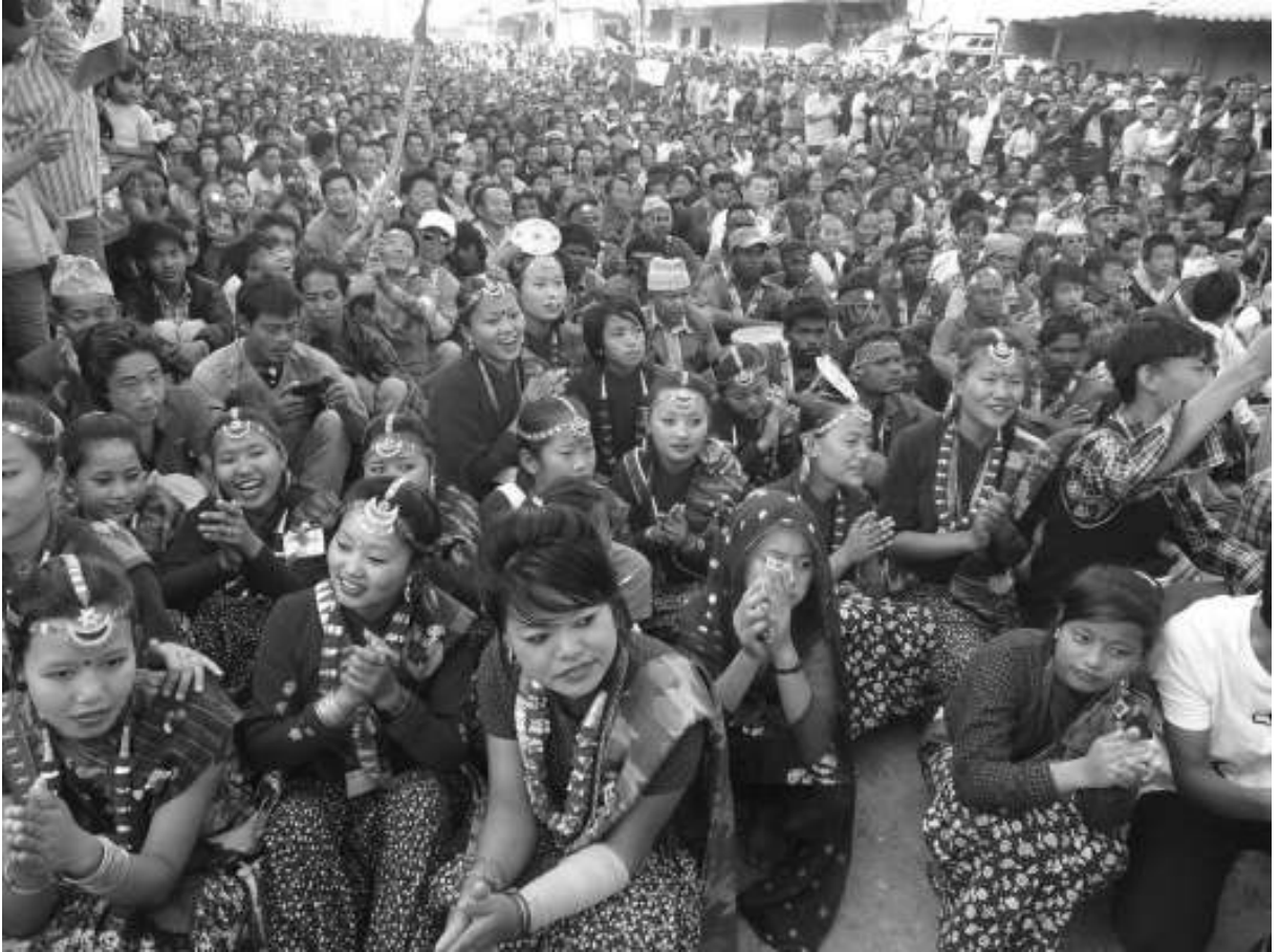
२०६८ मंसिर १० गते लिम्बुवानको विराटनगरमा संघीय लिम्बुवान राज्य परिषदद्वारा आयोजित शान्तिपूर्ण विशाल आमसभा ।

ठूलो आर्मी ब्याग पछाडि भिरेका, दुई साइडमा दुईवटा भण्डा ठड्याएका, सामान्य खाजा पानीको व्यवस्था र राति सुत्नलाई ओड्ने, ओछ्याउने कपडा त्यसैभित्र बोकेर लामवद्व युवाहरू लिम्बुवानको नारा घन्काउदै सडक र जङ्गल मार्चपासमा हिँड्ने गरेकाछन् । भट्ट देख्दा सैन्य टुकडीजस्तो देखिएता पनि बुढापाका र महिलाहरूको उल्लेख्य सहभागिताले यो मार्चपास सामान्य नै लाग्छ । निरन्तर १४, १५ घण्टा हिँडेर गन्तव्य छिचोल्न लाग्दासम्म पनि उनीहरूमा बाहिरी थकान, भोक र तिर्खा देखिँदैन । बरू, जोस, जाँगर र उर्जा सलबलाएको देखिन्छ ।